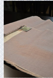
お楽しみ大抽選会 1等賞品 【本場結城紬地機反物】